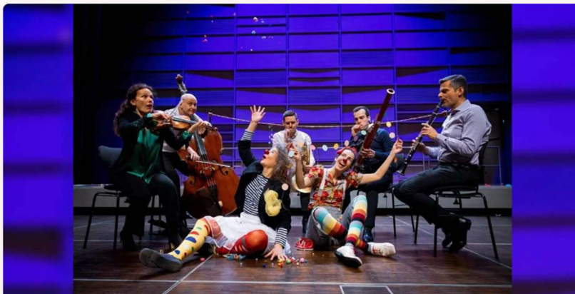
Till Eulenspiegel - eemol anescht!