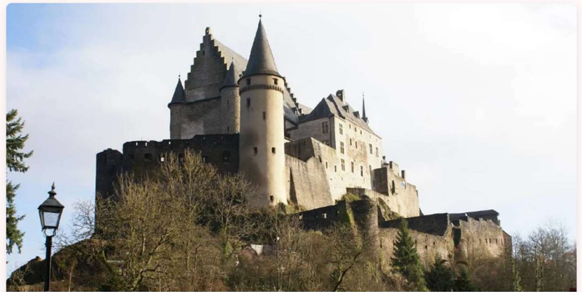
Veianen Schloss

Eng kuerz Nouvelle aus der Welt vun der Klassik oder aus anere Beräicher