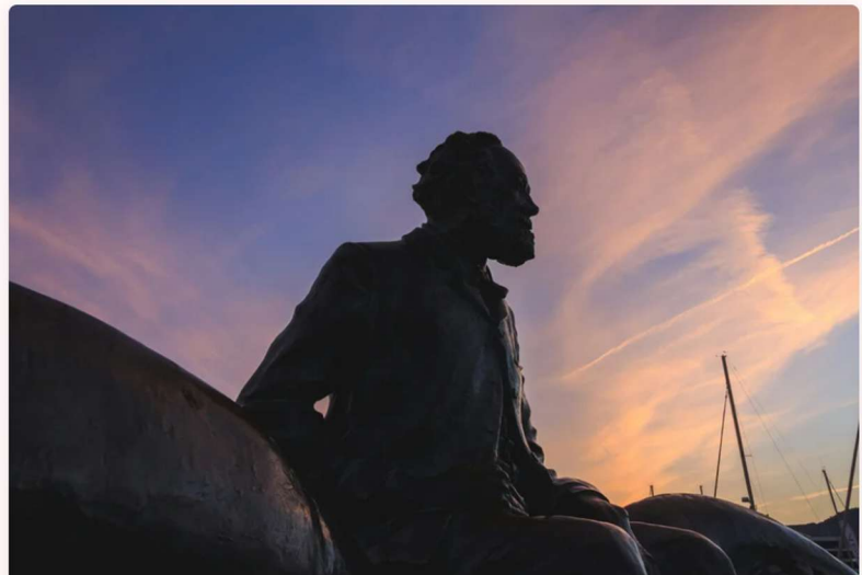
Jules Verne