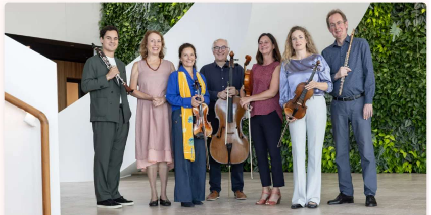
Ernstes Spiel Gespielter Ernst