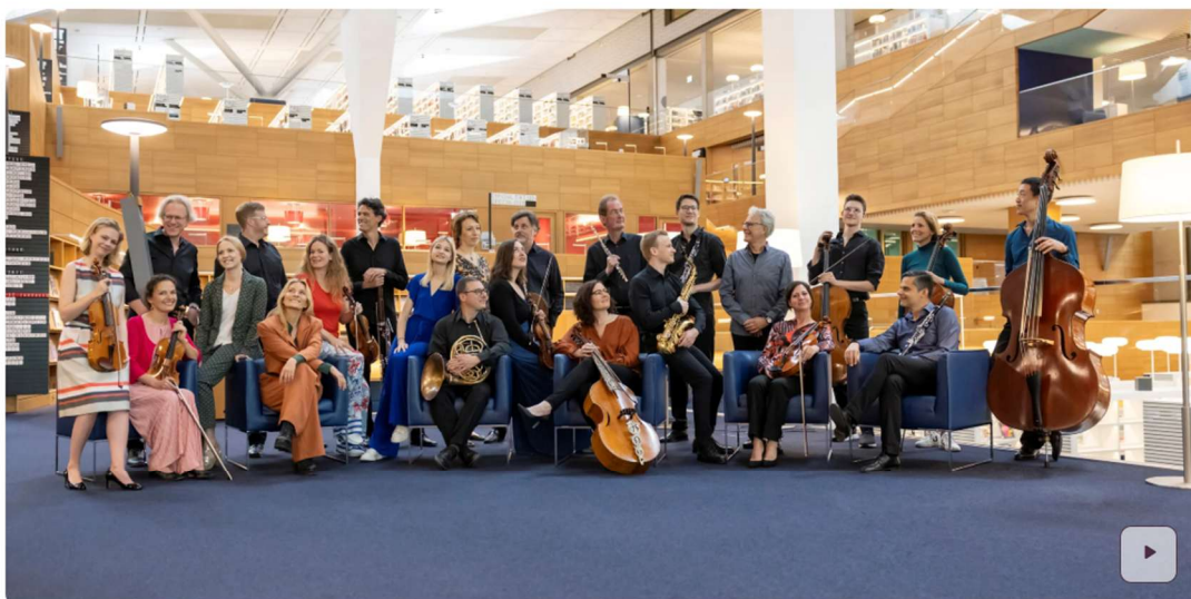
Kammerata Luxembourg

D'Kammerata Luxembourg steet zanter 40 Joer fir d'Promouvéiere vun der Kammermusek. Dobäi ass et de Museker:inne besonnesch wichteg déi zäitgenëssesch Musek erëm méi an de Vierdergrond ze réckelen. Zanter hirer Grënnung hunn si zum Beispill 13 Wierker fir den Ensembl schreiwe gelooss, an dat vu Komponisten déi alleguer op déi eng oder aner Aart a Weis eng Verbindung mat Lëtzebuerg hunn. Mee net nëmmen hei am Land kann een e Concert vun der Kammerata lauschtere goen, si sinn nämlech och am Ausland aktiv. De leschte Sonnden 31. August huet d'Kammerata zum Saison-Optakt e Concert um Konz Musik Festival gespillt. Um Programm stoungen do Wierker vum Arnold Schönberg a vum Olivier Messiaen.